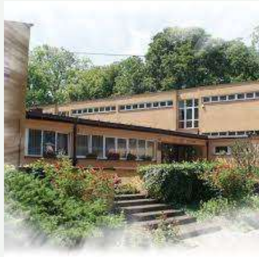
Zespół Szkół im. Wincentego Witosa w Zarzeczu

Η ιστορία του σχολείου μας χρονολογείται από το 1947. Από τη δεκαετία του 1970 άνοιξαν νέες σχολές στις εγκαταστάσεις και εφαρμόστηκαν παιδαγωγικές καινοτομίες, όπως η πολιτική εκπαίδευση. Εστιάζουμε στην ανάπτυξη της εκπαίδευσης σύμφωνα με τις ανάγκες της αγοράς εργασίας μακροπρόθεσμα. Αυτή τη στιγμή εκπαιδεύουμε στα τμήματα τεχνικού logistics, υπηρεσιών διατροφής και εστίασης καθώς και τεχνικό αγρότη. Στο σχολείο φοιτούν περίπου 200 μαθητές. Σε μεγάλο βαθμό, πρόκειται για άτομα από αγροτικές περιοχές, με δύσκολη οικονομική κατάσταση, που συχνά ασχολούνται ήδη με την εργασία σε οικογενειακές φάρμες. Οι νέοι του σχολείου χρησιμοποιούν πρόθυμα έργα και ευκαιρίες που στοχεύουν στην αύξηση των πρακτικών ικανοτήτων και αντιμετωπίζουν τα επαγγελματικά θέματα πολύ πιο σοβαρά από τη γενική εκπαίδευση. Σε αυτό το πλαίσιο, ένας από τους στόχους μας είναι να αυξήσουμε τη συμμετοχή των μαθητών σε δραστηριότητες που στοχεύουν στην ενίσχυση των βασικών ικανοτήτων.