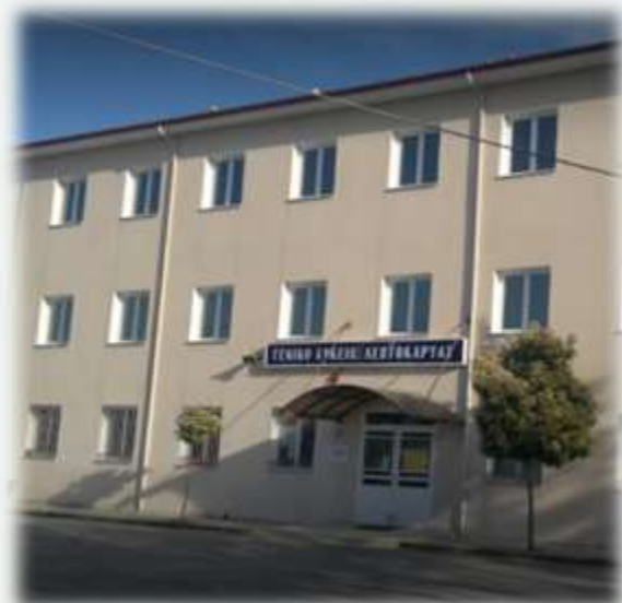
Λεπτοκαρυά Γενικό Σχολείο

Το Γυμνάσιο Λεπτοκαρυάς βρίσκεται στο κέντρο της Λεπτοκαριάς, σε ένα σχολικό συγκρότημα με το Γυμνάσιο στη Λεπτοκαρυά, στο δικό του κτίριο, όπου γίνονται διδακτικά μαθήματα. Το Γενικό Λύκειο Λεπτοκαρυάς είναι ένα δημόσιο λύκειο που ιδρύθηκε το 2007. Αυτή τη στιγμή φοιτούν στο λύκειο 202 μαθητές, οι οποίοι εκπαιδεύονται από την ομάδα των 25 καθηγητών πλήρους απασχόλησης.