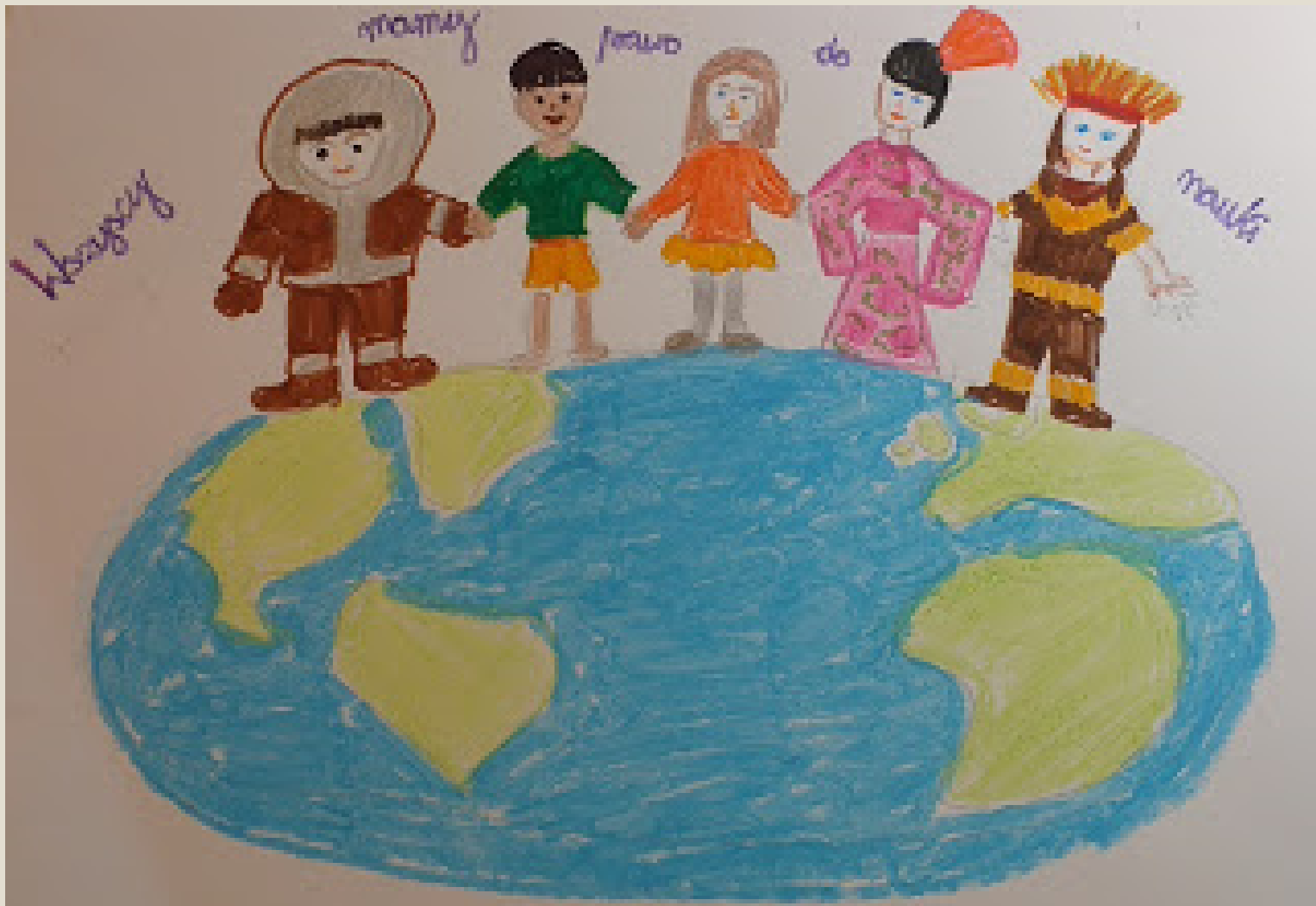
Weronika Zawada kl 4b